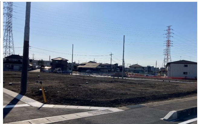
建築条件付分譲宅地<2区画>